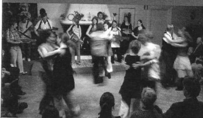
Föreställning med ettårskurserna 07-08